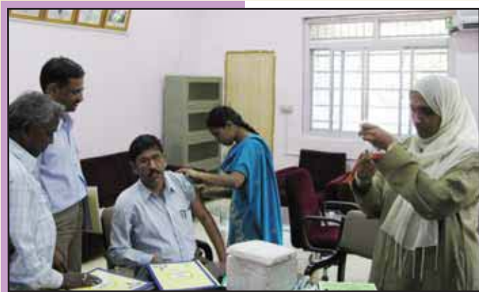
Vaccines being administered to the staff