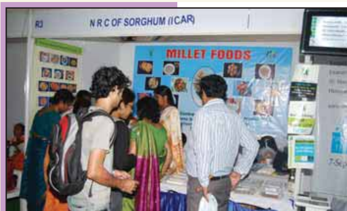
Visitors keenly observing delicacies made from sorghum grain

NRC Sorghum set up a stall in the trade carnival organized by the Confederation of Women Entrepreneurs (COWE) at People's plaza, Necklace road, Hyderabad during 4-7 September, 08. More than 500 visitors including 20 entrepreneurs visited the sorghum stall. The importance of sorghum as health and nutritious food was explained to the visitors and the relevant literature was distributed. They were told about the acceptability of sorghum foods as health food in urban areas, and how these products are becoming popular for diabetic or jaundice affected, and obese people. The